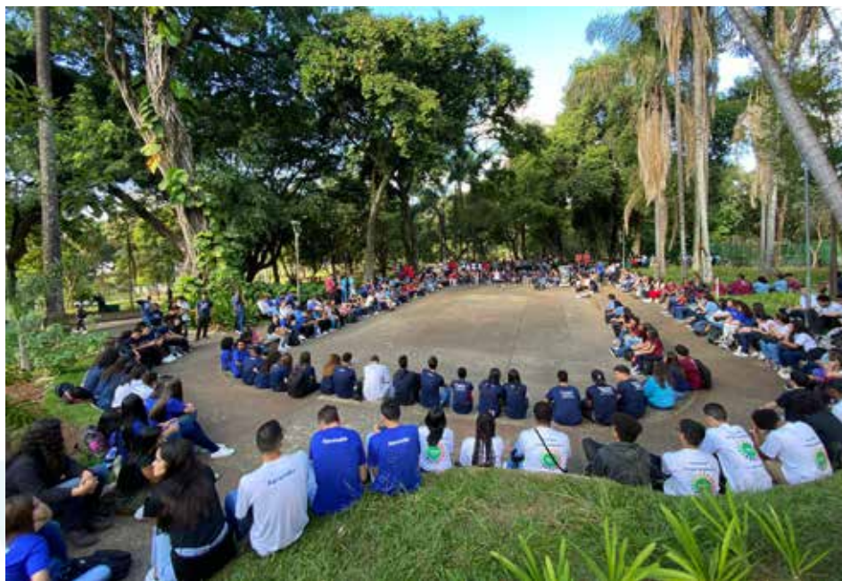
Aprendizes participam de ato promovido pelo Fectipa para o combate ao trabalho infantil