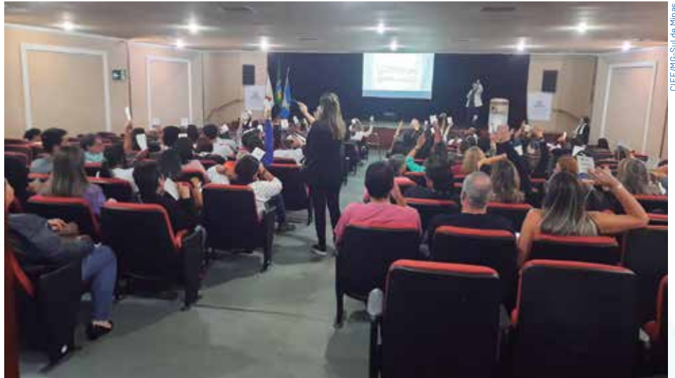
Parcial do auditório do Congresso de assistência social em Varginha