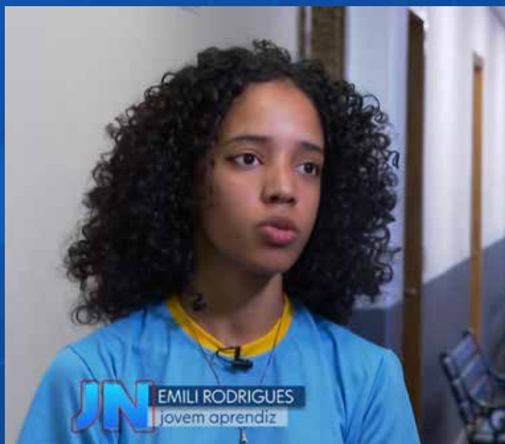
Emili tenta ultrapassar barreiras para realizar seu sonho