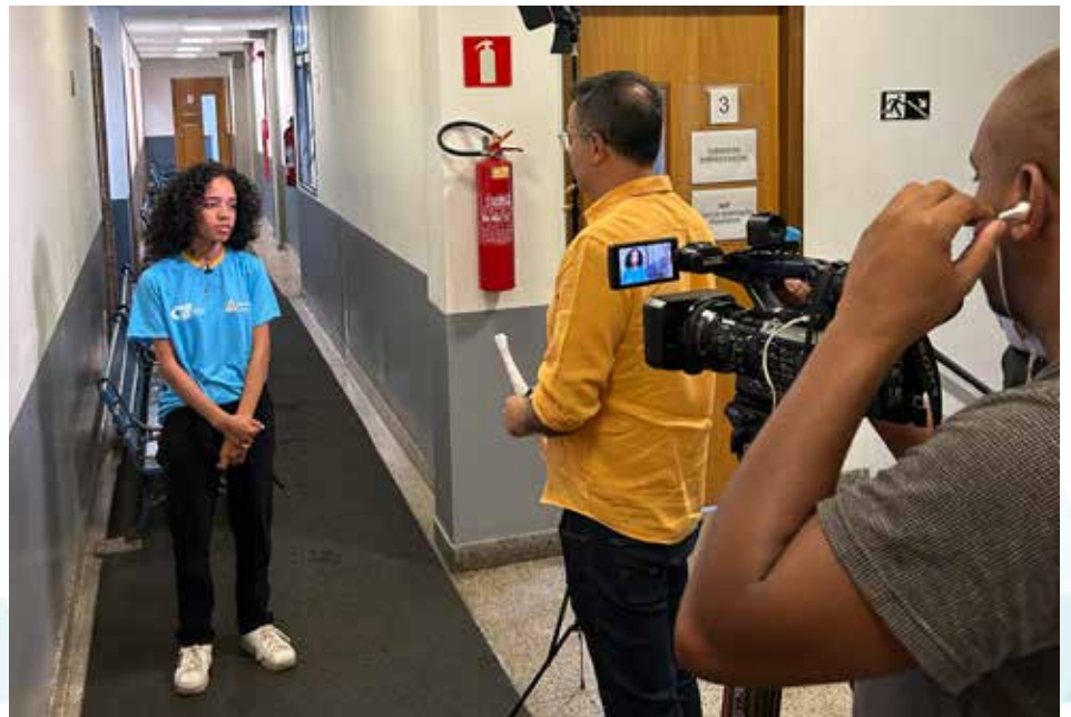
Emili com a reportagem da TV Globo na Sede do CIEE/MG

Especialistas na área de educação defendem que é preciso avançar na qualidade do ensino a distancia, aumentar a oferta de vagas nas instituições públi-